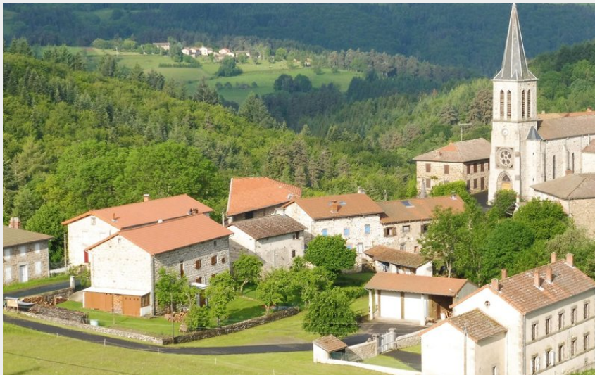
Vue sur le bourg de Baffie